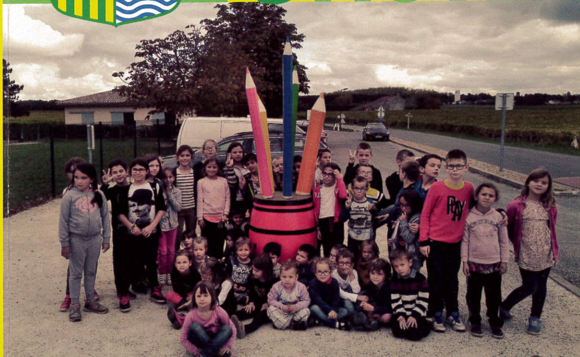
Création réalisée par les enfants durant les TAP