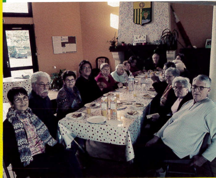
Création maquette et mise en page : www.cortex360.fr

samedi 31 mars (Pâques) , samedi 30 juin